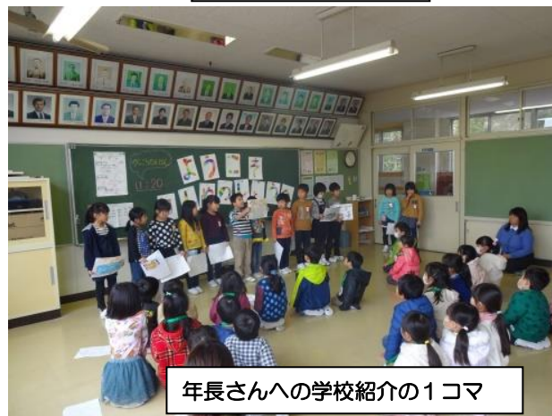
年長さんへの学校紹介の1コマ