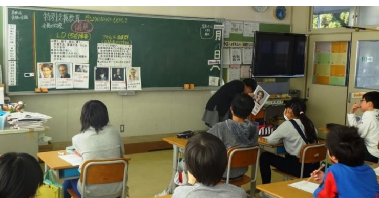
「困難さ」についての理解を通して、自分を見つめる6年生

をしてしまうことも振り返り、改めて「発達障がい」について理解を深めながら、自分はこれからどうするかを考える意義深い学習でした。自分の内面を見つめ、友達と対話しながら、なかなか答えが見つからないことも考え続けます。これは、将来、様々な違いをもつ他者と関わり、協働して問題解決を図っていく力として生きて働く深い学びであると考えています。