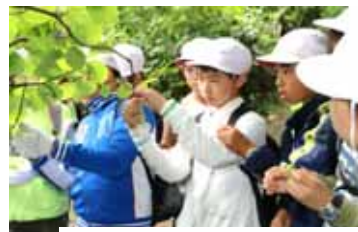
【5年宿泊学習での自然観察】

夏休み中は交通事故にあわないように十分気を付けて、けじめのある生活をするように各学級でも話をしました。8月20日の登校再開日にはエネルギーを蓄えた129名が元気に顔をそろえられるよう願っています。