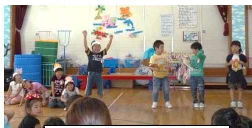
国語の学習成果を保育園で発表する1年生。

皆様もご承知のとおり、社会情勢を反映して、大学入試制度もいよいよ「思考力・判断力・表現力」を評価できる方向に改革が進み、山形県の高校入試制度の内容も変わっていきます。本校でも子どもが主体的に考えること、判断すること、表現することを授業の中で丁寧に指導し、生活のあらゆる場面を学習の場と捉えて、子どもたちを育てていきたいと思っております。どうぞ、ご家庭でも学習習慣、生活習慣へのご配慮をよろしくお願い申し上げます。