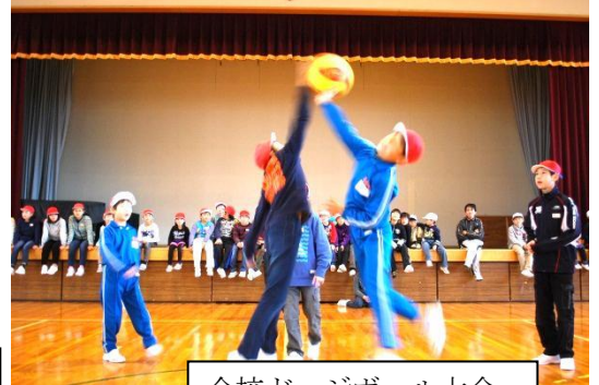
全校ドッジボール大会