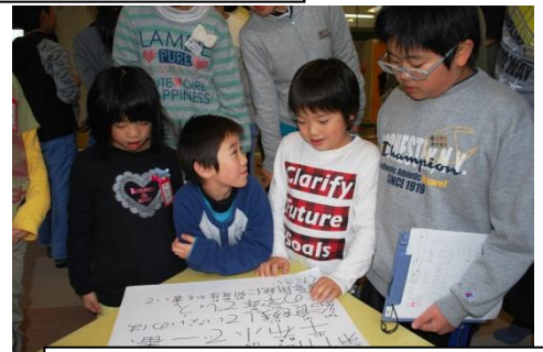
保健委員が準備した健康や栄養に関するクイズを縦割り班の仲間と考える。