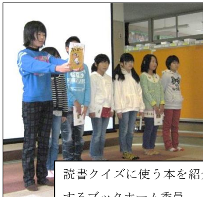
読書クイズに使う本を紹介するブックホーム委員

特に、先月末から今月にかけて児童会の精力的な動きがありました。6年生を中心に各委員会で学校生活を楽しむための活動が企画されました。読書週間を盛り上げるためにブックホーム委員会では、読書クイズ会。ロング昼休みを利用して、スポーツ委員会がドッジボール大会、保健委員会が健康・栄養クイズラリーを行いました。環境委員会では、自然をテーマにしたイラスト大会を行いました。放送委員会は、各学年数名に得意なことを披露してもらった番組を制作。朝活動の時間帯に放映し、好評を得ました。計画委員会でも、わんぱく活動という集会をして全校生の仲を深めました。状況に応じた判断や力を合わせるようになっていくところも頼もしいです。