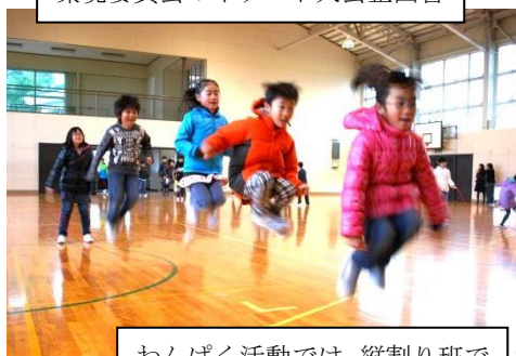
わんぱく活動では、縦割り班で長縄とびもした。