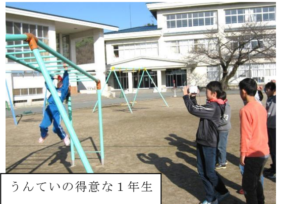
うんていの得意な1年生の撮影をする放送委員